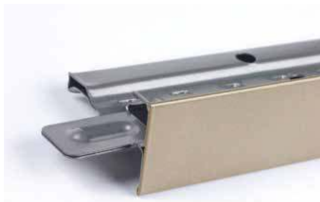
Peinture de la face