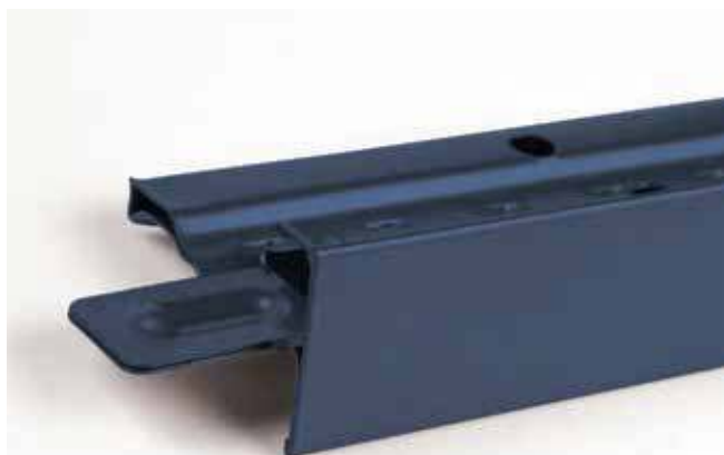
Peinture sur 360°

Cela permet une plus grande flexibilité des couleurs et une meilleure traçabilité tout au long du processus.