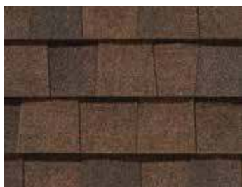
Terre de Sienne brûlée Burnt Sienna