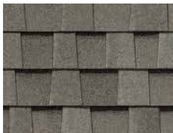
Gris pavé Cobblestone Gray