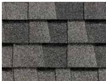
Gris d'étain Pewterwood