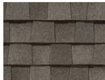
Bois délavé Weathered Wood