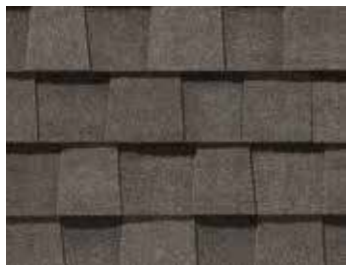
Bois de grève Driftwood