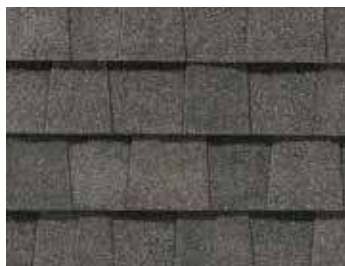
Ardoise coloniale Colonial Slate