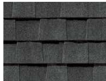
Noir moiré Moiré Black