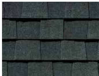
Noir charbon de bois Charcoal Black