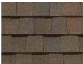
Mélange bruyère Heather Blend