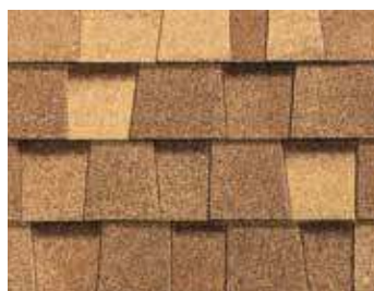
Bardeau rescié Resawn Shake