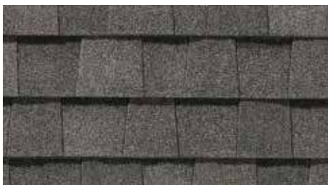
Ardoise coloniale Colonial Slate