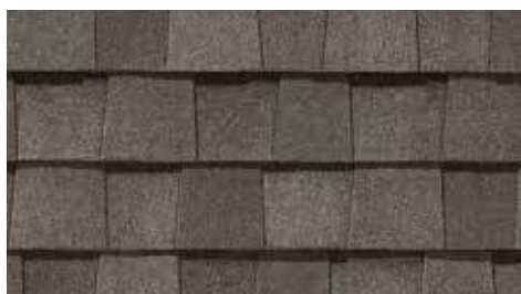
Bois délavé Weathered Wood