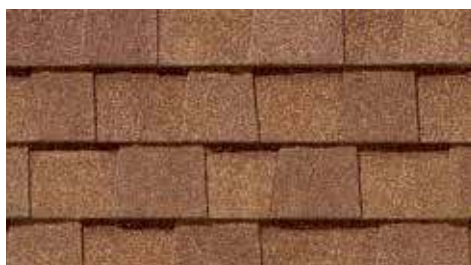
Bardeau resciné Resawn Shake