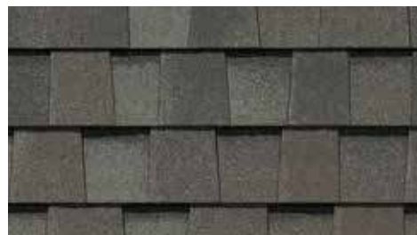
Gris Georgetown Georgetown Gray