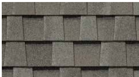
Gris pavé Cobblestone Gray