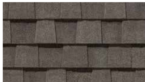
Bois de grève Driftwood