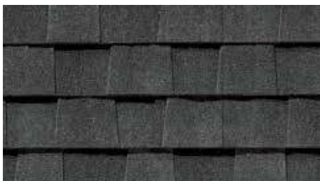
Noir moiré Moiré Black