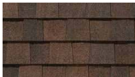
Terre de Sienne brûlée Burnt Sienna