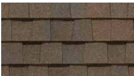
Mélange bruyère Heather Blend