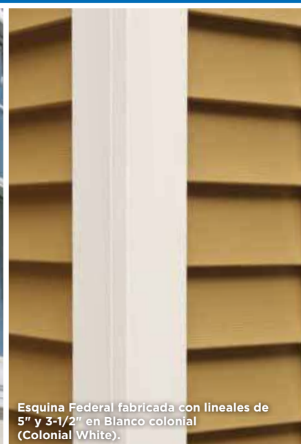
Esquina Federal fabricada con lineales de 5" y 3-1/2" en Blanco colonial (Colonial White).