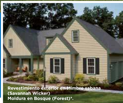
Revestimiento exterior en Mímbré sabana (Savannah Wicker) Moldura en Bosque (Forest)*.