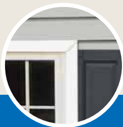
Lineal de 3-1/2" con esquinas cortadas e ingleteadas