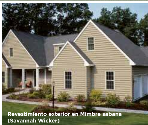
Revestimiento exterior en Mimbre sabana (Savannah Wicker)

Techos: Tejas Landmark™ en Gris Georgetown (Georgetown Gray).