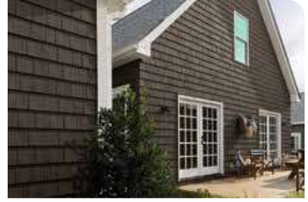
LISTONES Y TEJAS DE POLÍMERO