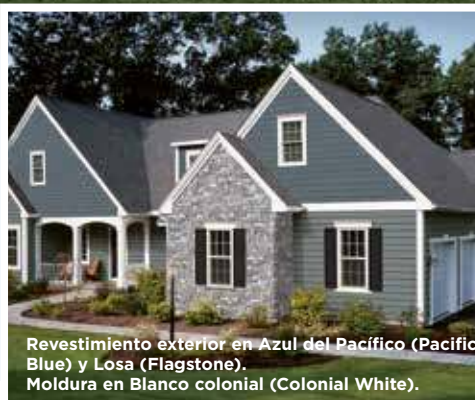
Revestimiento exterior en Azul del Pacífico (Pacific Blue) y Losa (Flagstone). Moldura en Blanco colonial (Colonial White).

Techos: Tejas Landmark en Gris Georgetown (Georgetown Gray).