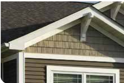
MOLDURAS VINYL CARPENTRY®