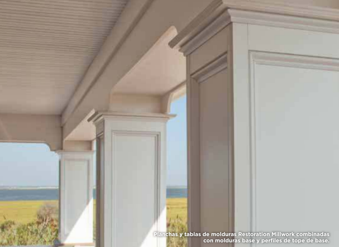
Planchas y tablas de molduras Restoration Millwork combinadas con molduras base y perfiles de tope de base.