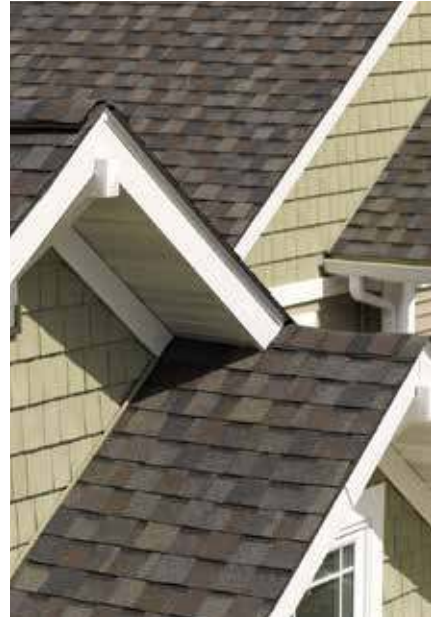
TECHOS Y VENTILACIÓN