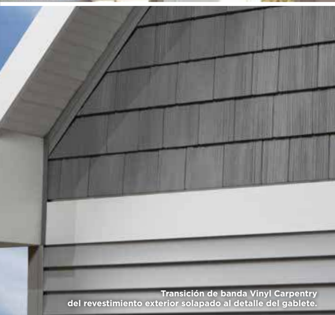
Transición de banda Vinyl Carpentry del revestimiento exterior solapado al detalle del gablete.

Molduras: Vinyl Carpentry® y Restoration Millwork®.