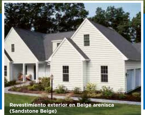
Revestimiento exterior en Beige arenisca (Sandstone Beige)