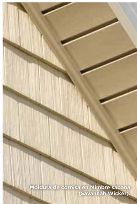
Moldura de cornisa en Mimbre sabana (Savannah Wicker).