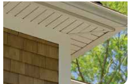
SOFITO DE VINILO Y METAL