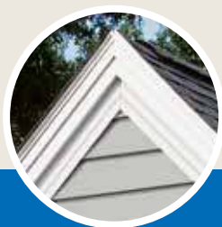
Molde de cornisa Vinyl Carpentry* con caída de aluminio