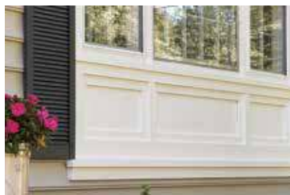
MOLDURAS EXTERIORES DE PVC Y TABLA CON REBORDE