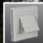
Ventilación de secadora