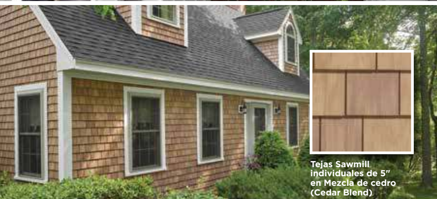
Tejas Sawmill individuales de 5" en Mezcla de cedro (Cedar Blend)