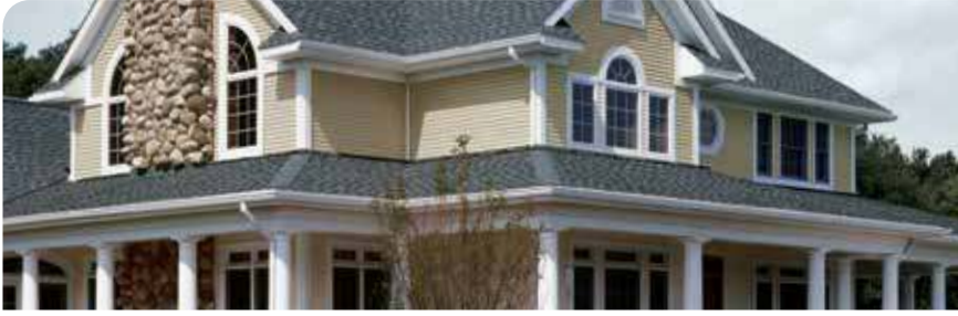
REVESTIMIENTO DE VINILO

Los productos CertainTeed están diseñados para funcionar en conjunto y complementarse entre sí en color y estilo a fin de darle a cualquier vivienda un acabado ideal.