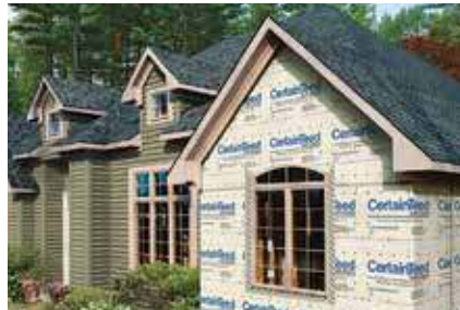
ENVOLTURA DE CASA