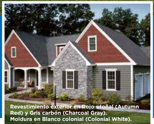
Revestimiento exterior en Rojo otoñal (Autumn Red) y Gris carbón (Charcoal Gray). Moldura en Blanco colonial (Colonial White).