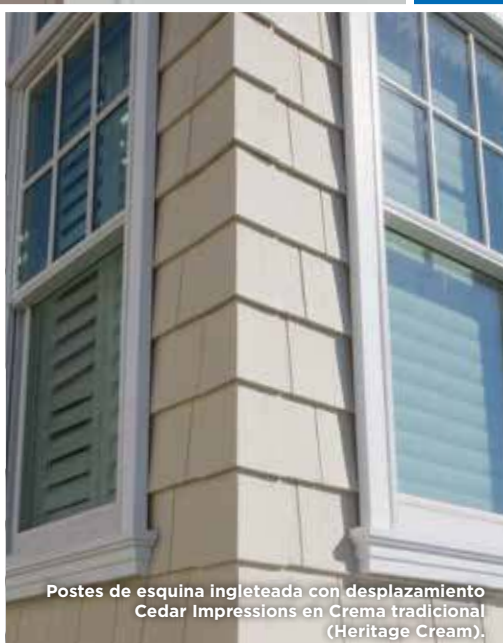
Postes de esquina ingleteada con desplazamiento Cedar Impressions en Crema tradicional (Heritage Cream).