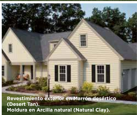
Revestimiento exterior en Marrón desértico (Desert Tan). Moldura en Arcilla natural (Natural Clay).

*Restoration Millwork pintado con Pintura Color Safe de Sherwin-Williams.