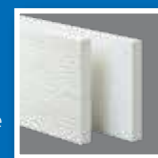
Tablas de moldura

La moldura de PVC celular se corta, se manipula, se acanala y se aserra del mismo modo que la madera de alta calidad.