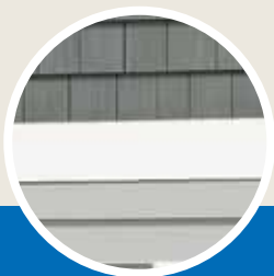
Tabla de moldura Restoration Millwork*