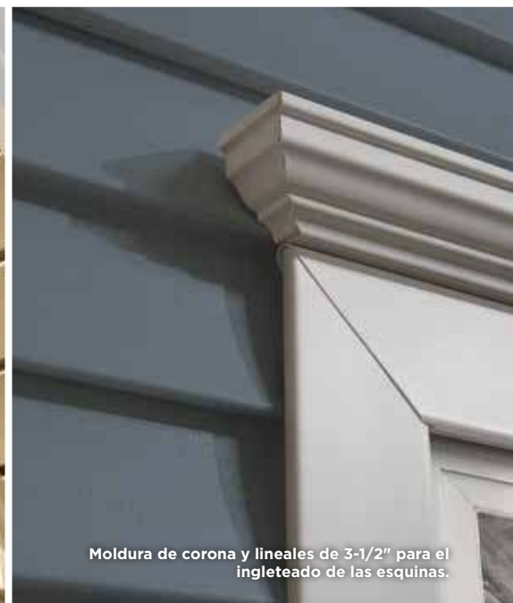
Moldura de corona y lineales de 3-1/2" para el ingleteado de las esquinas.